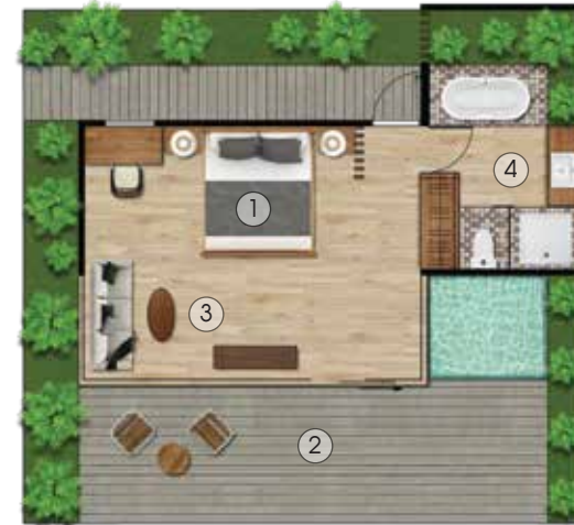
Mặt bằng / Plan Layout