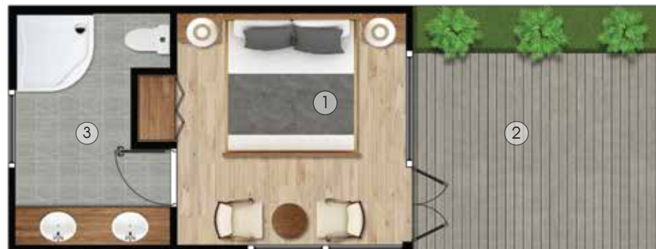
Mặt bằng / Plan Layout